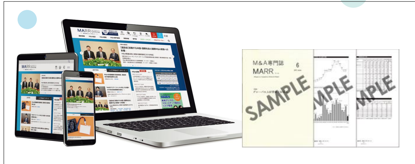
MARR（マール）の誌面にご登場いただいた実務家、専門家などを講師としてお迎えし、「マールM&Aセミナー」も開催

M&A専門誌「MARR（マール）」、「MARR Online（マールオンライン）」を通じて、最新のM&A事情を多面的に発信しています。