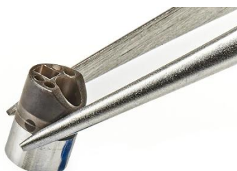
内視鏡の先端部品