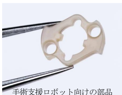
手術支援ロボット向けの部品