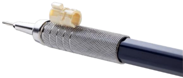
カテーテル向けのハウジング部品