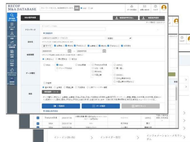
検索や集計機能が充実

検索・分析ツール「レコフM&Aデータベース」の提供を通じて、M&Aの実務家、研究者、政策担当者を支援しています。