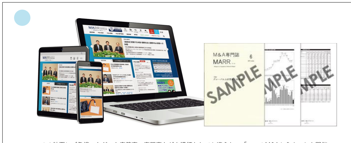
マールの誌面にご登場いただいた実務家、専門家などを講師としてお迎えし、「マールM&Aセミナー」も開催

M&A専門誌「MARR (マール)」、「マールオンライン」を通じて、最新のM&A事情を多面的に発信しています。